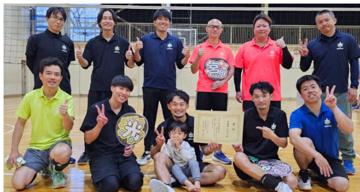
男子の部 準優勝 藤沢市立秋葉台小学校