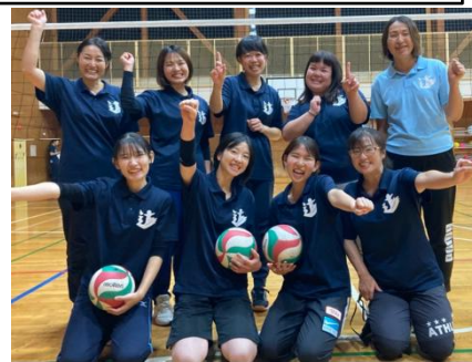
女子の部 第3位 藤沢市立辻堂小学校