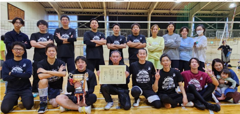
男子の部 優勝 茅ヶ崎市立西浜小学校

11月8日（土）、湘南教組バレーボール湘南大会が、男子は鎌倉市立玉縄中学校、女子は藤沢市立藤沢小学校で行われました。男女ともに1回戦から熱戦が繰り広げられ、どのチームも互いに譲らず、1点1点の重みがとても感じられる試合となりました。