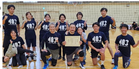
男子の部 第3位 茅ヶ崎市立汐見台小学校

11月8日、玉縄中学校体育館で行われた湘南バレーボール大会、決勝戦は茅ヶ崎西浜小学校と藤沢秋葉台小学校の対戦となりました。