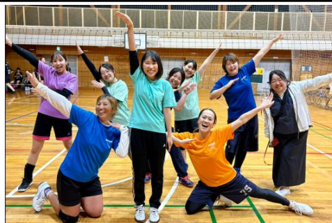
女子の部 第3位 藤沢市立羽鳥小学校

今年は、土曜日の天候不良による運動会延期やインフルエンザの早い時期の流行により、亀井野小・小坂小の2校が残念ながら、欠場となりました。