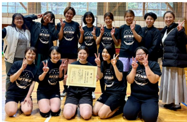
女子の部 準優勝 茅ヶ崎市立松浪小学校