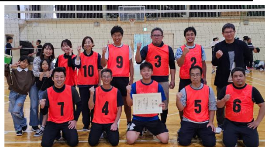
男子の部 第3位 鎌倉市立大船中学校