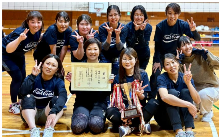
女子の部 優勝 茅ヶ崎市立東海岸小学校